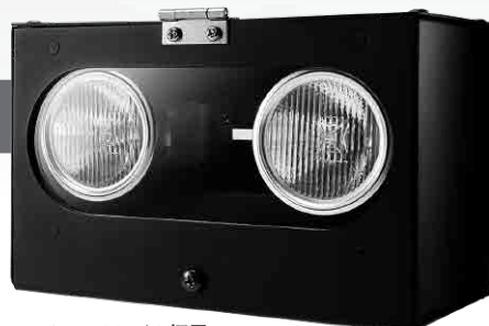
HySiL1500 / 2灯用

ハイパースペクトルカメラ・近赤外線カメラなどの近赤外線センサー用に開発された照明です。HySiL1500はライン・エリアどちらにも適した高照度照明ユニット。4灯用と2灯用の2種類をラインアップ。