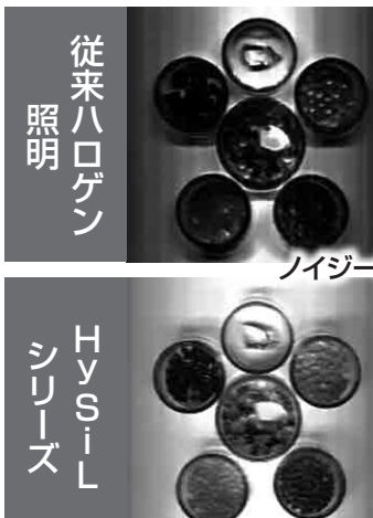
従来ハロゲン照明